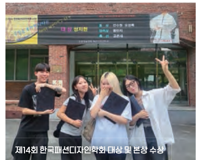
제14회 한국패션디자인학회 대상 및 본상 수상