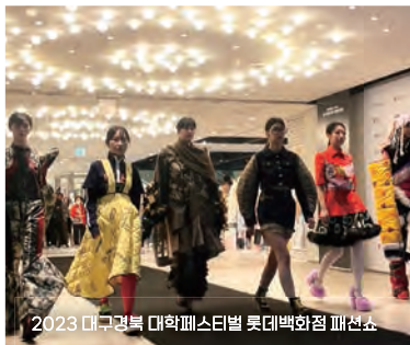
2023 대구경북 대학패션페스티벌 롯데백화점 패션쇼