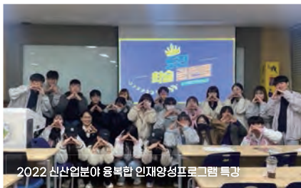
2022 신산업분야 융복합 인재양성프로그램 특강