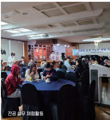
전공 실무 체험활동