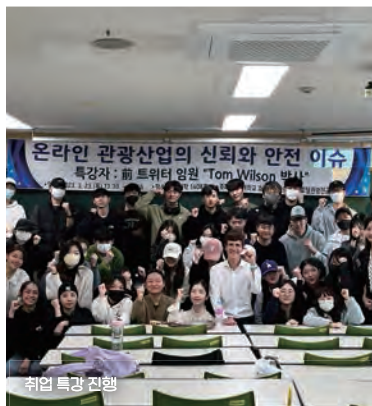
취업 특강 진행