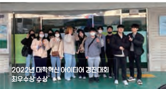
2022년 대학혁신 아이디어 경진대회 최우수상 수상