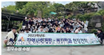
2022년 대학혁신 아이디어 경진대회 최우수상 수상